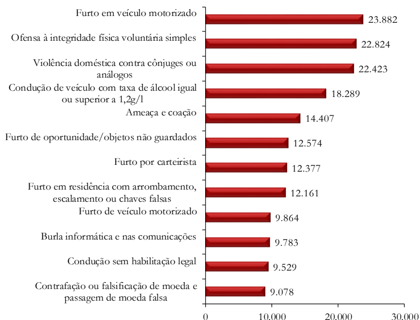
Figura 2 - Alguns crimes registados pelas forças policiais, em 2018

A figura 2 coloca em destaque algumas das categorias de crimes mais frequentes, entre as quais surge o crime de “furto em veículo motorizado” com 23.882 crimes e o crime de “ofensa à integridade física voluntária simples” com 22.824 crimes 2 .