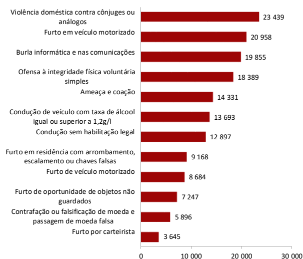
Figura 2 - Alguns crimes registados pelas autoridades policiais, em 2020

A figura 2 coloca em destaque algumas das categorias de crimes mais frequentes, entre os quais surge o crime de “violência doméstica contra cônjuges ou análogos” com 23.439 crimes e o crime de “ofensa à integridade física voluntária simples” com 18.389 crimes 2 .