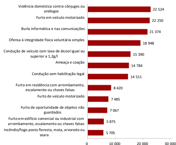
Figura 2 - Alguns crimes registados pelas autoridades policiais, em 2021

A figura 2 coloca em destaque algumas das categorias de crimes mais frequentes, entre os quais surge o crime de “violência doméstica contra cônjuges ou análogos” com 22.524 crimes e o crime de “furto em veículo motorizado” com 22.250 crimes 2 .