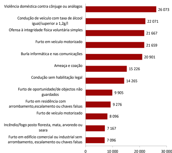
Figura 2 - Alguns crimes registados pelas autoridades policiais, em 2022

A figura 2 coloca em destaque algumas das categorias de crimes mais frequentes, entre os quais surge o crime de “violência doméstica contra cônjuges ou análogos” com 26.073 crimes e o crime de “condução de veículo com taxa de álcool igual/superior a 1,2 g/l” com 22.071 crimes 2 .