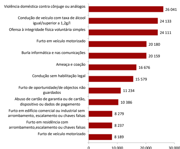
Figura 2 - Alguns crimes registados pelas autoridades policiais, em 2023

A figura 2 coloca em destaque algumas das categorias de crimes mais frequentes, entre os quais surge o crime de “violência doméstica contra cônjuges ou análogos” com 26.041 crimes e o crime de “condução de veículo com taxa de álcool igual/superior a 1,2 g/l” com 24.133 crimes 2 .